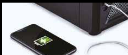
USB-Anschluss zum Aufladen des Smartphones