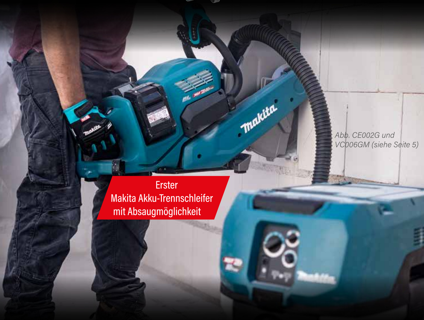
Abb. CE002G und VC006GM (siehe Seite 5)

Diamantscheibe im Lieferumfang abweichend