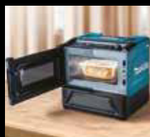
LED-Display mit Anzeige der Restlaufzeit und verbleibender Akku-Kapazität